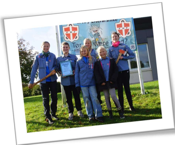
Vindere af Efterårshike 2022: What the Flip